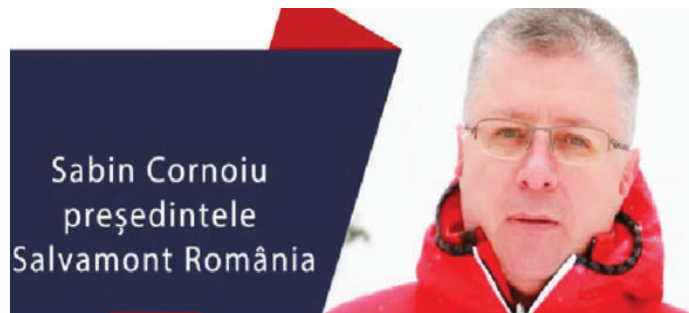
Sabin Cornoiu președintele Salvamont România

Când avem condiții bune de zbor și aparate de zbor care pot ajunge în timpul util la noi preferăm să facem acest lucru, preferăm să limităm timp în care pacientul ajunge la spital. Îi dăm șanse mai mari de vindecare sau supraveghere”, susține șeful Salvamont. Șeful Salvamont susține că numărul mare de turiști accidentați este cauzat de aglomerația de pe părții, dar și de ciocnirile dintre cei avansați și cei începători. „A fost o zi frumoasă pe munte, oamenii au fost atrași în special să meargă spre stațiunile de practicare a sporturilor de alunecare. Am avut un număr extraordinar de oameni la ski și săniuș. Era normal, știam acest