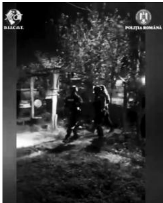
al IPJ Gorj, în timpul cercetărilor.

Cei doi părinți din Cluj, acuzați că și-au „vândut” bebelușul unui bărbat de 47 de ani, din Tismana, pentru 7.000 de euro, vor rămâne în arest în timpul procesului. Decizia a fost luată vineri, de magistrații Tribunalului Gorj. Aceeași hotărâre a fost luată și în cazul celui care a „cumpărat” nou-născutul, însă nu este definitivă.