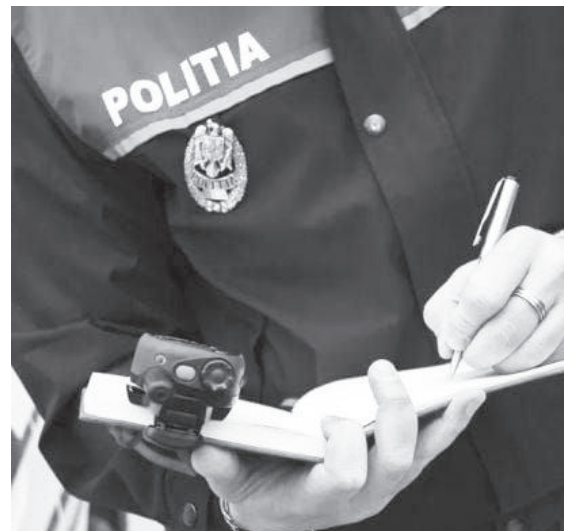
femeii. Polițiștii au întocmit dosar penal, pentru amenințare și distrugere.

Bărbatul a formulat plângere penală și a fost emis un ordin de protecție provizoriu împotriva