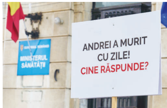
Solicitare către Ministerul Sănătății

„Soluționarea cu celeritate a procesului penal reprezintă obligația organelor judiciare de a desfășura urmărirea penală și judecata într-un termen rezonabil, fără întârzieri nejustificate, astfel încât drepturile părților să fie efectiv protejate, principiu garantat de Constituția României și de Convenția Europeană a Drepturilor Omului. Modul în care autoritățile gestionează decesul unui copil într-o unitate sanitară de stat afectează direct încrederea cetățenilor în sistemul medical. Menținerea dosarului penal nesoluționat de aproape un an și jumătate, fără emiterea unui rechizitoriu sau a unei soluții clare, nu face decât să prelungească starea de incertitudine și să lase impresia că neglijența medicală poate rămâne nepedepsită”, transmite FACIAS.