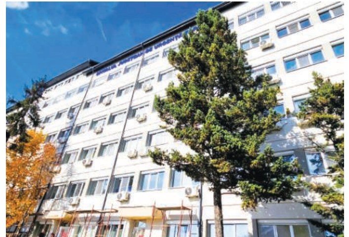
de îngrijitoare curățenie. Au fost ocupate doar posturile pentru îngrijitoare.

În cazul mai multor candidați pentru același post, se va organiza interviu pe data de 26 martie 2026, la sediul administrativ al spitalului, unde vor fi evaluate abilitățile profesionale, capacitatea de analiză, motivația, comportamentul în situații de criză și inițiativa. Recent, tot prin transfer la cerere, spitalul a mai scos la angajare șase posturi de infirmiere și două