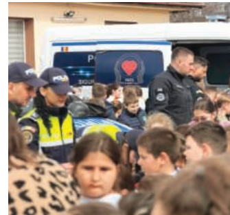
Ziua Poliției, sărbătorită timp de o săptămână în Gorj

La acțiuni au participat structurile de siguranță școlară, prevenire, rutieră, criminalistică, acțiuni speciale și protecția animalelor. Vizitatorii au avut ocazia să descopere îndeaproape tehnica și armamentul din dotarea polițiștilor, dar și să afle cum sunt folosite acestea în misiunile de zi cu zi. Micii participanți au primit de la polițiști orare, cărți de colorat, pliante, semne de carte, bomboane și, pe alocuri, îmbrățișări. Atracția principală a fost MAX, câinele de urmărire, care a impresionat prin abilitățile sale și demonstrațiile oferite, stârnind admirația tuturor, de la cei mici până la cei mari. Evenimentul s-a desfășurat într-un cadru aparte, în apropierea festivității de premiere din cadrul Salonului Internațional de Pictură „Arte Mici”, unde siguranța și cultura s-au îmbinat armonios.