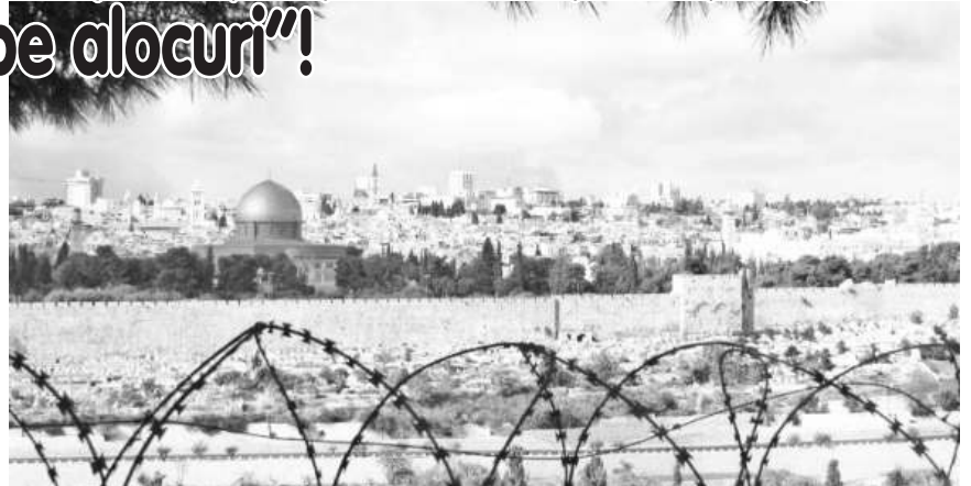
Iisus și nu a fost de acord cu arestarea Domnului.

cum se arată în Evanghelia după Ioan, susținea că e mai bine «să moară un om pentru popor, decât să piară tot neamul», pentru că, după aceea, ei să-și facă planul. A doua zi, Iisus s-a pregătit de Sărbătoarea Paștelui în Sala de Sus, numită «Coenaculum» pe colina de vest a Ierusalimului și cunoscută mai târziu ca «Muntele Sionului». Așa că în timpul cinei, Iisus află că apostolul său Iuda Iscarioteanul l-a trădat pentru treizeci de arginți, dar nu-și schimbă planul de a merge să se plimbe prin liniștita livadă de măslini din Grădina Ghetsimani, aflată de cealaltă parte a Văii Chedron, unde Iuda dispăre. Nu se spune dacă el l-a trădat pe Iisus pentru că îl considera prea radical sau insuficient de radical, din cupiditate sau din invidie. Mai târziu, Iuda s-a întors cu o poteră alcătuită din preoți importanți, gărzile ale Templului și legionari romani, și chiar dacă aceștia nu l-au recunoscut imediat pe Iisus în întunericul nopții, Iuda l-a trădat, identificându-l printr-un sărut, iar, apoi și-a primit banii. Într-o scenă haotică desfășurată la lumina tortelor, apostolii și-au scos săbiile, Petru a tăiat urechea unuia dintre servitorii marelui preot și un băiat al cărui nume nu-l știm a fugit gol pușcă, pierzându-se în noapte, fiind vorba despre un amănunt atât de straniu, încât pare veridic. Iisus a fost arestat, iar apostolii săi s-au împrăștiat, mai puțin doi care l-au urmărit de la distanță. Era aproape miezul nopții, când Iisus, sub