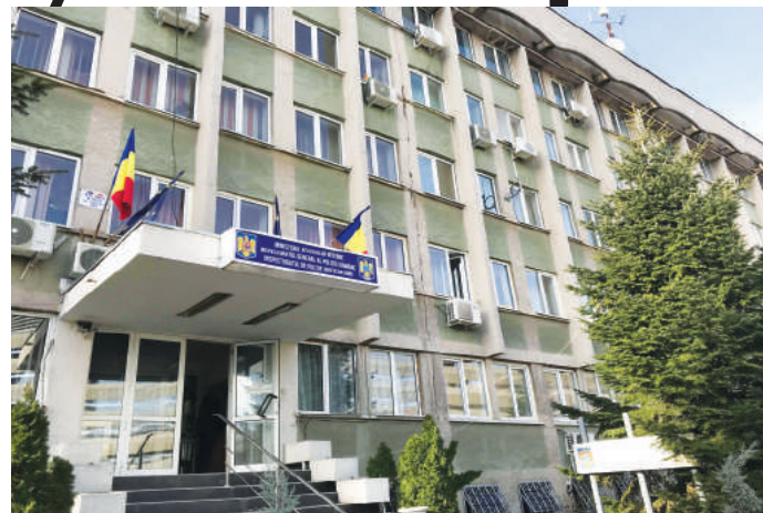
Rezultatele finale, anunțate pe 8 iunie

trebuie să obțină minimum nota 7,00. Aprecierea rezultatelor finale ale probei se face cu note de la 1 la 10 (1 punct se acordă din oficiu). Candidatul nemulțumit de rezultatul obținut la proba/probele eliminatorie/eliminatorii sau la testul scris, respectiv de rezultatul la concursul pentru ocuparea postului de conducere vacant, poate formula contestație, o singură dată pentru fiecare probă, în termen de 24 de ore de la afișare. Candidații pot contesta numai notele la propriile lucrări. Contestațiile se soluționează în termen de două zile lucrătoare”, se mai precizează pe portalul de servicii de la nivelul Ministerului Afacerilor Interne.